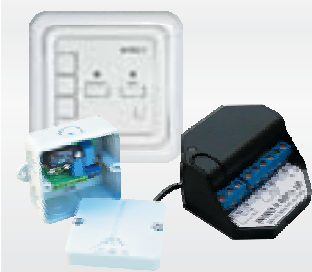
Приемники для установки в помещении и на улице

Системы Radio и Intro II отличаются условиями, в которых необходимо проводить автоматизацию здания. Система Intro II предназначена для зданий, где прохождение команд управления по радио затруднено: наличие толстых оштукатуренных стен, ворот с металлическим полотном, близость теле- и радиовышек и т.д.