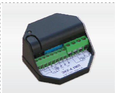
Устройство контроля доступа для управления роллетами на дверных проемах