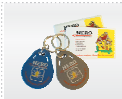
Пластиковые карта и брелок