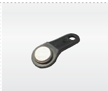
Чип (электронный ключ-таблетка)