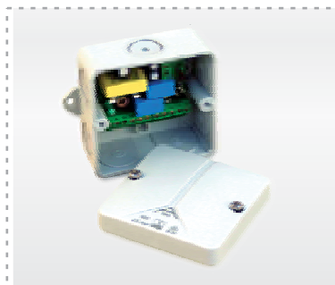
Устройство контроля доступа для управления воротами