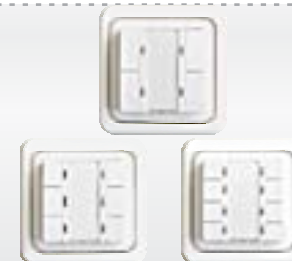
Сценарные пульты на 4, 6, 8 сценариев

Арт. Radio 8151(8152) Арт. Intro II 8551(8552)